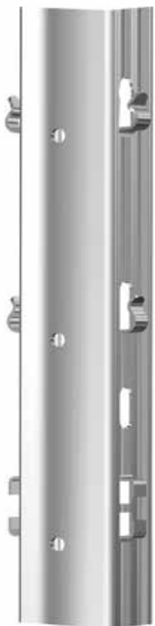
Alsó huzal rész