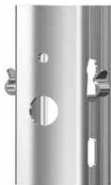
Felső huzal rész