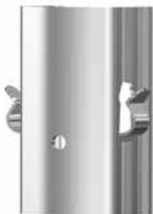
huzal váltó rész